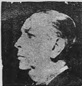
GOTELLI / SAN SEBASTIAN